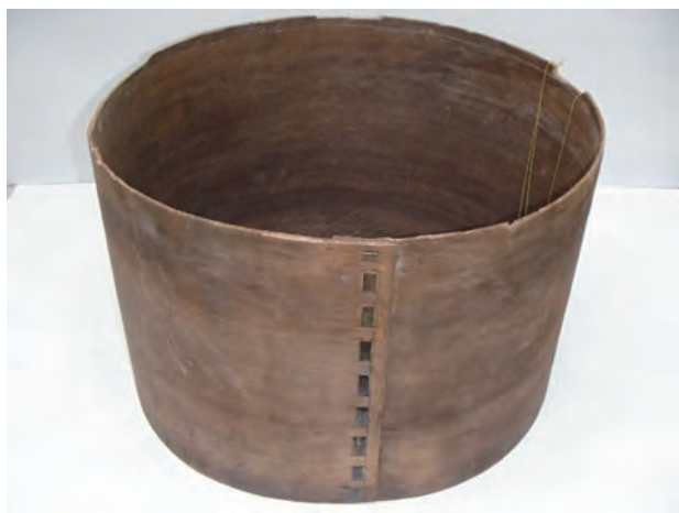
▲新堂前遺跡(新堂町)から出土した鎌倉時代の曲物

この冬は、ことさらに寒さが厳しく、ようやく待ちわびた春が訪れました。市内の桜は満開で、花見をする人々が桜樹の元、色とりどりの弁当箱を広げ、家族や知人と楽しくだんらんしている姿が目につかびます。現在、弁当箱といえばプラスチック製のものが普及していますが、檜や杉材を用いた「わっぱ」弁当を愛用している方もおられるでしょう。この「わっぱ」という言葉の語源は「輪」を意味すると考えられています。私たちが日々の生活の中で使用している道具やその呼び方には、過去からの長い歴史が詰まっています。木製の容器については、その用途や作り方によって、さまざまなものがあり、丸太の一本や厚板から工具を使って削り抜く「刳物」、轆轤 くわだまがら を使って円形のものを作り出す「挽物」、板材を組み合わせて作る「差物」、薄板を円形・楕円形に曲げ、桜皮などを使って綴じ込み、容器を作る「曲物」などがあります。