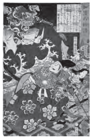
▲歌川芳年画「和漢百物語 田原藤太秀郷」(草津市蔵・中神コレクション)

江戸時代の「旅ブーム」に影響を与えたといわれる『東海道中膝栗毛』や、多くの浮世絵に描かれた「俵藤太の百足退治伝説」など、街道・宿場まつわる物語や伝説などを紹介します。