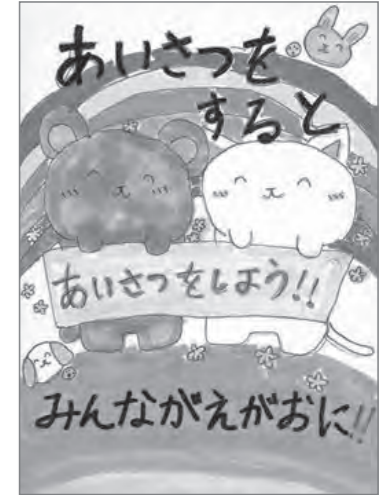
▲昨年度の大賞作品

「家庭・学校・地域の連携を深め、社会全体で取り組む青少年の健全育成」をめざして、「市民総ぐるみの挨拶(あいさつ)運動」を推進する作品を募集します。 ●募集作品 ①俳句・標語部門(文章のみ) ②絵画・写真部門 他・作品の著作権や版権などは、主催者に帰属します ・作品は返却しません 申 9月4日(月)まで(必着)に、小・中学生は氏名・学校名・学年・応募部門・作品のタイトル・作品への夢と思いを書いて、各学校に提出。一般の人は、住所・年齢・電話番号を書いて、事務局に直接か郵送で提出。①はファクスかEメールで提出可 申・問 市青少年育成市民会議事務局(さわやか保健センター 2階、子ども家庭・若者課内) ☎561-6899、FAX561-6780、☎kodomo@city.kusatsu.lg.jp