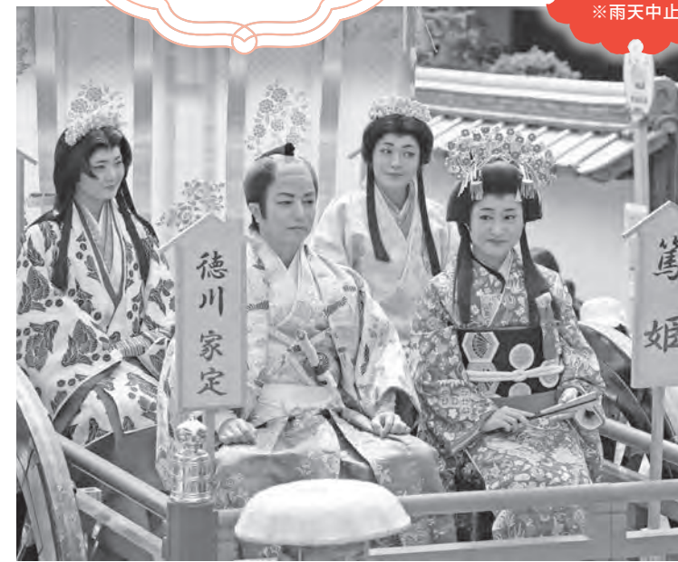
第51回のおきの時代行列の様子