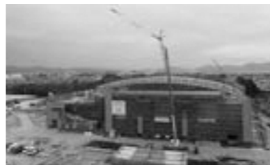
▲オープンに向けて鋭意建設中!