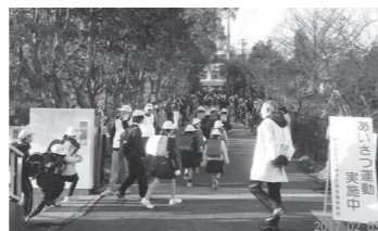
▲登下校時の見守り

存在がいることを、ぜひ知ってほしいたび。 今年の12月1日、次の民生委員児童委員さんが選ばれるたび。社会奉仕の精神を持って、自分の住んでいる地域を良くしたい、地域福祉の向上に関わりたい、みんなの民生委員児童委員としての輪の広がり、ご協力をお願いするたび～!