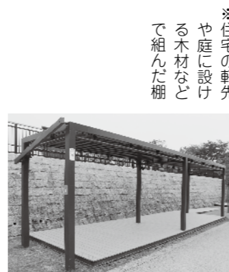
※住宅の軒先や庭に設ける木材などで組んだ棚

各地で大きな地震や豪雨による被害が発生しています。自然災害時、重要になるのは日頃の備えです。皆様も、今一度、身の回りの確認をお願いします。平成29年に草津川跡地公園ai彩ひろば、de愛ひろばがオープンして、はや2年が経ちました。公園内を、ウォーキングしたり、気持ちよさそうに犬を連れて散歩したり、カフェでくつろいだり、学生が文化祭の練習をしていたり、さまざまなスタイルで、日常的に利用されている姿を見るたびに、市民の憩いの場、交流の場となっていることを、ありがたく思っています。 このように、草津川跡地公園は、まちなかににぎわいをもたらすことをめざして整備しましたが、一方で防災公園の機能も担っています。阪神淡路大震災や東日本大震災での教訓を踏まえ、ハード・ソフト両面から、防災性の高い空間づくりを、構想段階からめざしてきました。草津川跡地の広大で連続した空間は、地形そのものが高い防災性を備えており、災害時には一時避難地の役割を果たします。 また、日ごろから市民の皆様