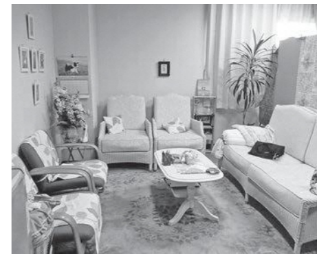
▲安心して相談できるOVSCの相談室

SATOCO(性暴力被害者総合ケアワンストップびわ湖)は、性犯罪や性暴力で被害にあった人をワンストップで支援するためのシステムで、OVSC(おうみ犯罪被害者支援センター)、滋賀県産科産婦人科医会、滋賀県警察、滋賀県が連携しています。 被害の連絡、相談は「SATOCOホットライン」で24時間、男女とも受け付けています。連絡すれば、医療ケア、心のケア、弁護士相談、警察への届出などの支援を総合的に受けられ、被害にあった人が事件後にさらに傷つくことがないように支援しています。 もし、あなたや友人、家族が被害にあったら、電話かメールで連絡してください。