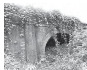
▲旧狼川トンネル(南笠東一)

草津市南部を流れる狼川は旧草津川と同様に、川底が周りの土地より高い天井川です。現在、JR線に橋が架かっていますが、かつては川の下をトンネルがくぐり、電車が通るようになった昭和31(1956)年に廃止されました。トンネルはアーチ式レンガ造、側壁は石組みで、複線が通れるように2つの穴が並んでいました。現在でも山側(東側)トンネルが土砂に埋もれながらも現存し、その北口部分は道路から見ることができません。 このトンネルの出入口部分は、縦柱と上部の横木で構成される冠木門形状をレンガで表現したデザインです。また、トンネル内部はレンガを積む方向が斜めに揃う「ねじりまんぼ」という珍しい工法で、精美な曲線が描き出されています。 滋賀県の鉄道史は、明治13(1880)年に東海道線京都―浜大津間が、同22(1889)年には草津駅を含む膳所―深谷(米原市)間が開業となりました。狼川のトンネルもこの開業に合わせて竣工しましたが、同33(1900)年の膳所―草津間の複線化に伴い、2つ穴のトンネルになったと考えられます。 このトンネルのように、私たちの身近なところにも歴史の足跡が残されています。 ※深谷(廃止)を除き、現在の駅名で記載しました