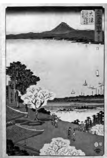
▲歌川広重画「五十三次名所図会 大津」(草津市蔵)