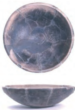
▲宮西遺跡出土 焙烙

今回紹介する「焙烙」は、宮西遺跡(南山田町)から出土しました。発掘調査の結果、弥生時代から室町時代にかけての遺構や遺物が多く確認できたことから、この地には人々が各時代にわたり、生活してきたことが分かっています。調査の中で出土した焙烙は、完全に近い形で出土し、直径が31・6cmで、高さが9cmありました。姿は大きなお皿のような形で、底が丸く、外面、内面ともに黒く煤けたような色をしているのが特徴です。 そもそも「焙烙」とは、現在では使われることは少なくなりましたが、茶や豆、ゴマなどを炒ったり、蒸し焼きにしたりするための調理器具で、炒り鍋ともいわれます。古くは、14～15世紀ごろから使われ始めたとき、宮西遺跡から出土した焙烙は形や、大きさなどから16世紀ごろのものと思われる。焙烙は素焼きの土器で、金属製の調理器具などに比べると熱が緩やかに伝わり、食材を焦がすことなく炒ることができるといわれています。現在でもコーヒーやほうじ茶の焙煎など、自分好みの風味を楽しむ人々に使われています。中世から伝わる調理器具でこだわりのおいしい一杯を楽しむのも良いかもしれませんね。