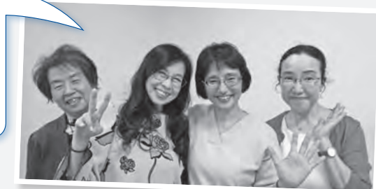
一緒に活動された女性役員の皆さん