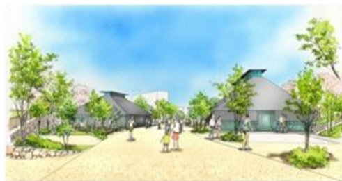
区間 5 商業施設イメージパース