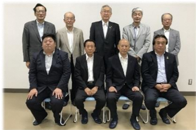
▲ 芦浦観音寺阿弥陀堂・書院を守る会メンバー