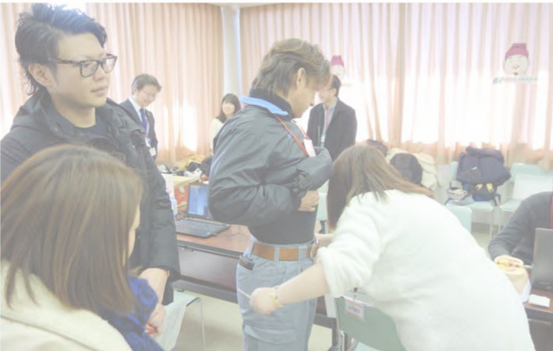
MBT研究所によるメタボ測定