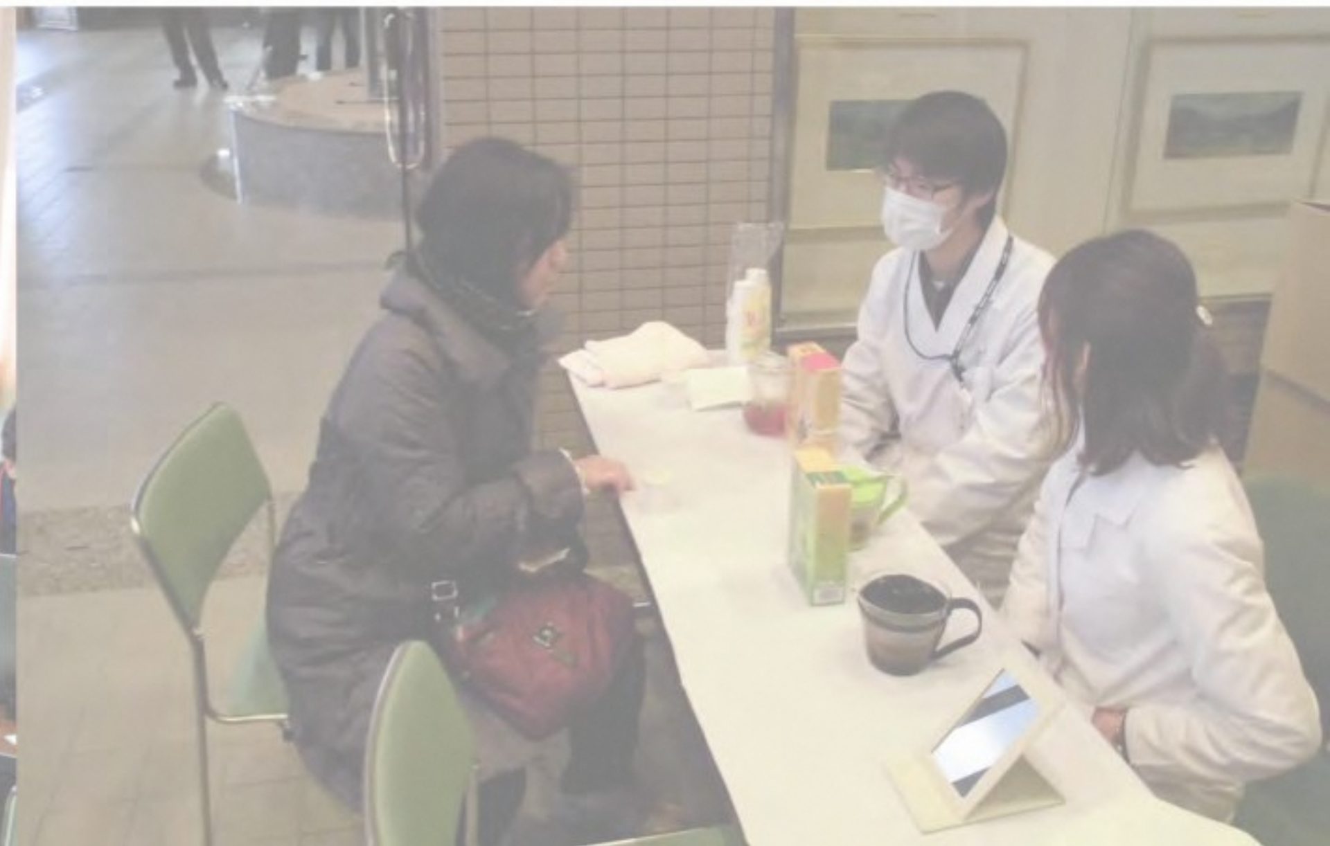
学生による漢方医学を用いた健康相談