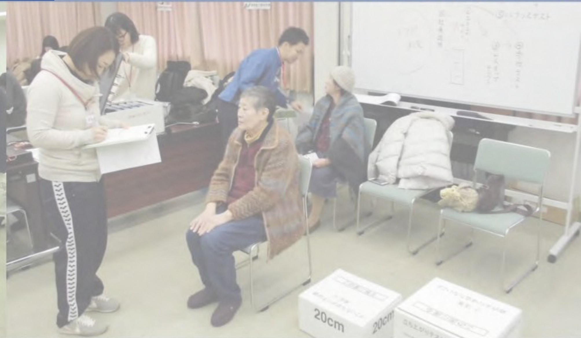
整形外科によるロコモ（運動器症候群）度テスト