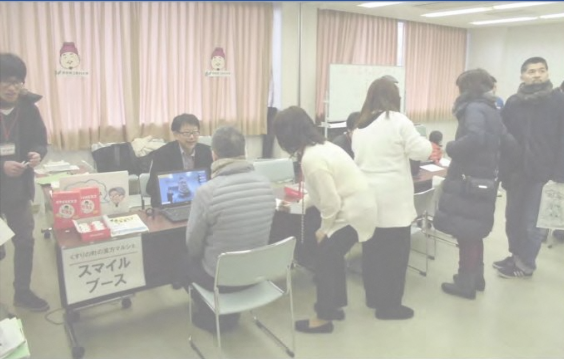
麻酔科による笑顔度測定