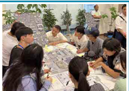
参加者それぞれが思う課題や魅力について話し合いました