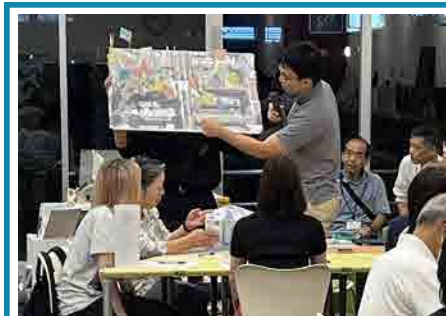
各グループで話し合った課題や魅力について発表し、参加者で共有しました