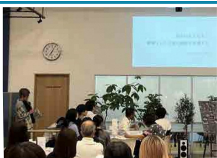
始めにレクチャーを行いました