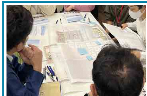
でてきた意見を「今回できる」「今回はできないが将来やろう」の2つにわけ、次回行う社会実験を決めました。