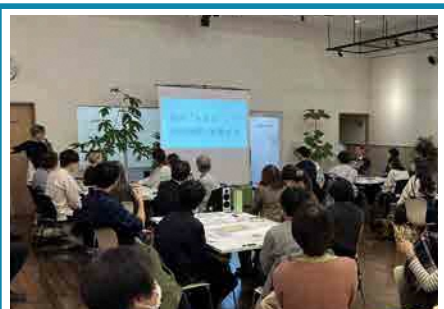
始めにレクチャーを行いました