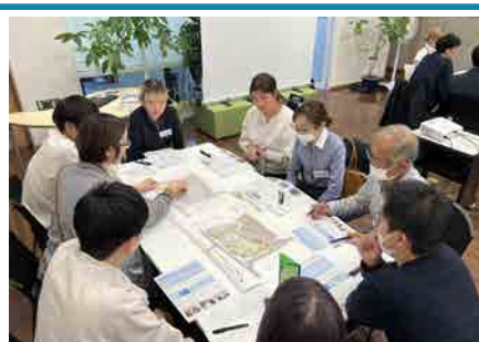
次回行う社会実験の内容について 意見を出し合いました。