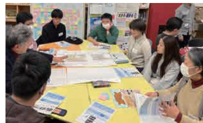
▲ワークショップ⑤の様子

提案計画図を見ながら、ワークショップ②で出てきたご意見と社会実験の体験をもとに南草津駅前広場でやりたい/できそうなコトを「いつ」「誰が」「どこで」「何を」について具体的に考えていただきました。