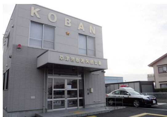
↑草津市内には、 げんざい 現在8つの交番やちゅうざい所があります。