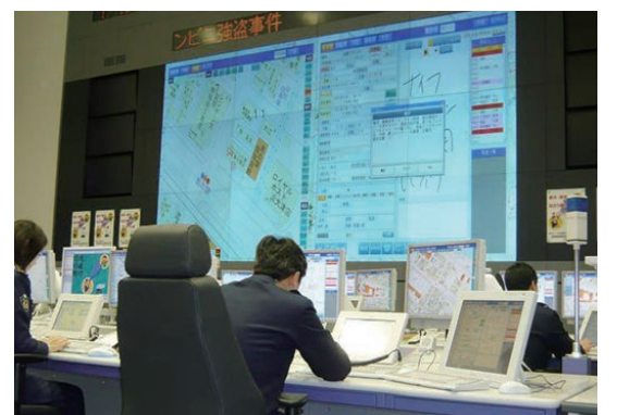
↑通信指令室の様子