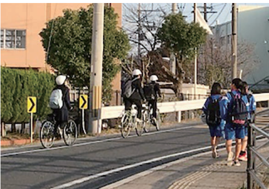
↑ 自転車用のヘルメットをかぶって登校する様子

※特に、13歳未満の子どもは、ヘルメットを着用するよう法律ですすめられています。