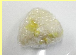
上手になった三角おにぎり