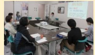
サポーター研修会の様子

【サポーターさんの感想】 ・「あすくるへつながってくる子ども達一人ひとりの良い所を認めていける者で有りたいです。」