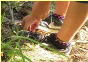
イガから栗を取り出す

過ぎ行く夏を惜しみながらもたくさんの夏野菜を収穫した屋上のあすくる農園では、さつま芋が収穫の時期を迎えています。さらに、これからの季節に恋しくなるのは「おでん」にかかせない大根です。あすくる農園の大根は、少年が種をまき、芽を間引きしたりしてお世話をし、すくすくと育っています。今から収穫が楽しみです。また、少年と一緒に旧少年センターに栗拾いに行きました。初めての栗のイガに苦戦しながらも楽しそうに栗を採る少年の姿は微笑ましかったです。そして、採れた栗で「栗ご飯」を炊き、おにぎりを作りました。「三角のおにぎりはよう作らん」と言って、やろうとしなかった少年に、ちょっとしたコツを伝授すると上手に作れるようになりました。少年たちには、秋の味覚を楽しむことで季節の移り変わりを感じてほしい、自然に目を向けることで心にゆとりを持ってほしい、また一緒に調理し、食事することで団らんの楽しさを感じてほしいと思っています。