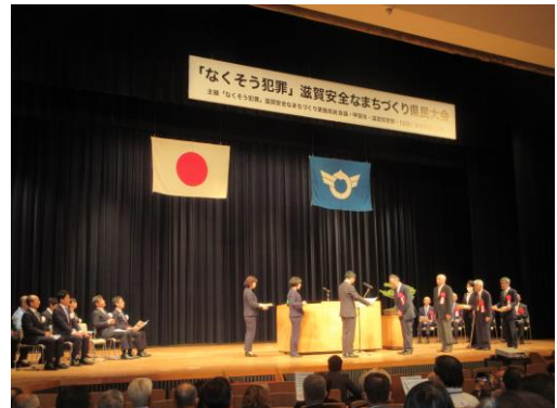
『「なくそう犯罪」滋賀安全なまちづくり県民大会』での表彰伝達の様子です。

10月7日(土曜)、少年補導(委)員として長年御尽力いただいた方々への表彰伝達が「あいこうか市民ホール」で行われました。草津市少年補導(委)員会で表彰されましたのは、次の方々です。心よりお祝い申し上げるとともに、長年に渡り少年の健全育成に関わっていただいておりますことに感謝申し上げます。