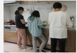
少年を囲んで調理実習中

青少年支援サポーターにはあすくる草津の活動において少年たちの支援を職員と共にしていただいています。