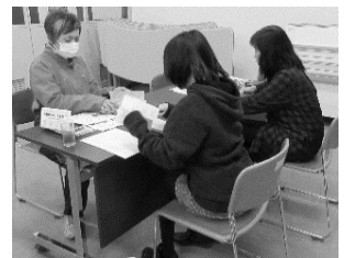
学習もがんばりました