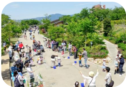
草津川跡地公園（区間5 de愛広場）