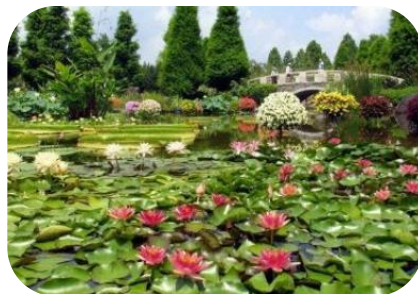
水生植物公園みずの森