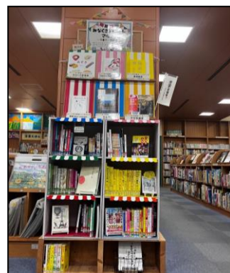
「パリオリンピック・パラリンピック」展示