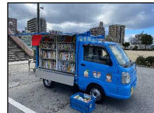
移動図書館「あおばな号」

約1,000冊の本と職員を乗せた自動車で市内の小学校およびまびこ教室へ月1回を目安に巡回して、図書館サービスを提供します。