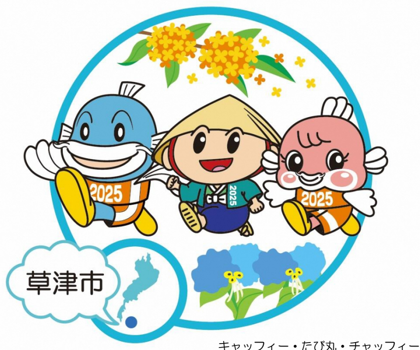
キャッフィー・たび丸・チャッフィー