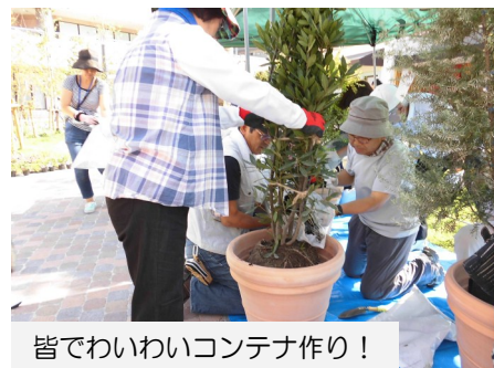
皆でわいわいコンテナ作り！