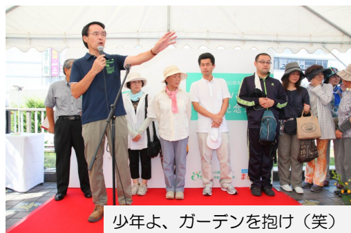
少年よ、ガーデンを抱け（笑）

7月26日（土）、草津駅東口デッキにて、niwa+（ニワタス）完成記念式典が開催されました。オープン前のniwa+ガーデンの植付会など、グラッシーの活動が紹介され、参列者からは、niwa+での今後の活動に対する期待が寄せられました。その後、沢尾代表より挨拶があり、朝早くから草津駅東口デッキのお手入れをしていたメンバーも一緒に壇上で、グラッシーの活動をPRしました。