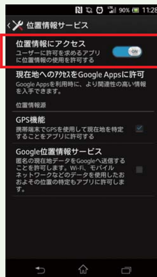
③『位置情報にアクセス』を『ON』に設定