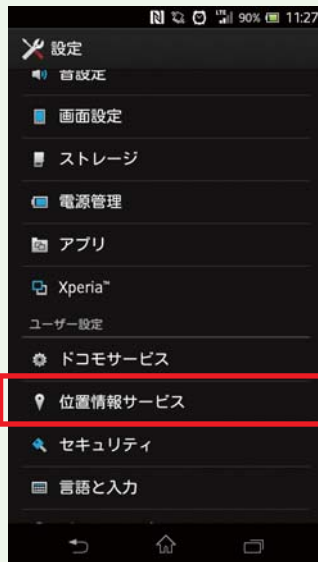
②『位置情報サービス』をタッチ