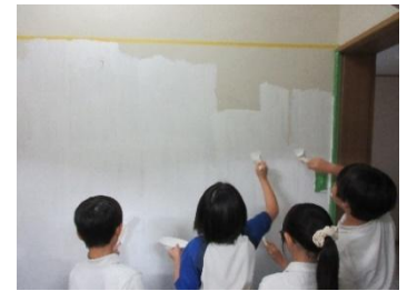
【白いペンキで下地作り】

2学期に登校してきたこどもを驚かせようと、地域から有志を募り、夏季休業中にこどもの手ではできない部分を中心に大人の手でトイレ掃除を行い、それぞれ担当したトイレの装飾を行った。