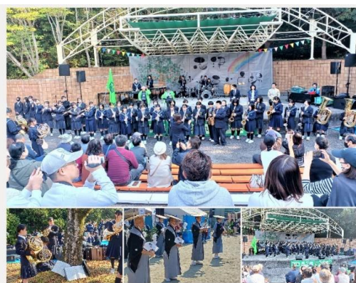
地域ふれあい祭り大盛況

快晴の3連休、気温もぐんぐん上がって11月とは思えない秋日和でした。 最終日の今日は、志津と矢倉のふれあい祭りが開催され、本校の吹奏楽部も大活躍でした。