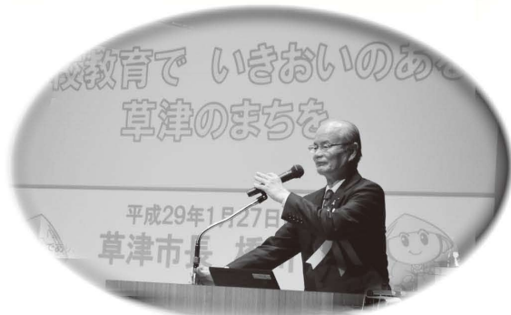
草津市の学校教育について説明する橋川市長