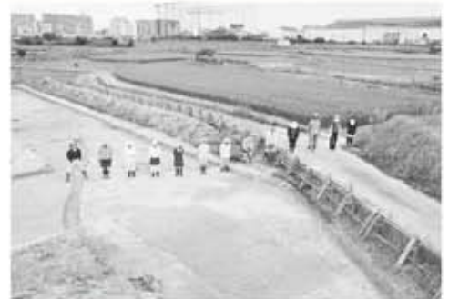
発掘された東山道跡と考えられる道路跡(人が並ぶ範囲)

文化財保護課では、平成27年度から南笠町・野路町地先で、区画整理事業に伴う埋蔵文化財発掘調査を公益財団法人滋賀県文化財保護協会の協力を得て実施しています。今回、事業地内の滋賀県文化財保護協会が調査する黒土遺跡にて、東山道跡と考えられる古代の道路跡が発見されました。東山道は、平城京(奈良県)と陸奥国府(宮城県)とを結び、県内では、近江国府を通過して本市に入った後、近世中山道に近いルートにて美濃国へと向かうとされています。なお、瀬田周辺に残る道路が東山道の痕跡とされていますが、県内ルート