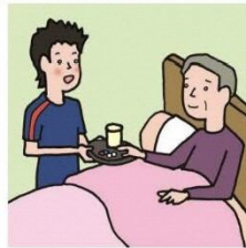
がん・難病・精神疾患など慢性的な病気の家族の看病をしている