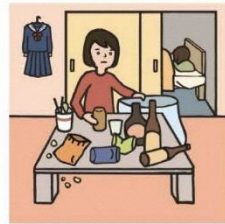
アルコール・薬物・ギャンブル問題を抱える家族に対応している