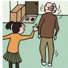
目を離せない家族の見守りや声かけなどの気づかいをしている