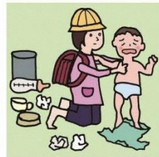
家族に代わり、幼いきょうだいの世話をしている