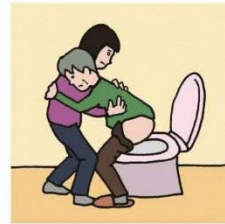
障がいや病気のある家族の入浴やトイレの介助をしている

©一般社団法人日本ケアラー連盟 / illustration : Izumi Shiga