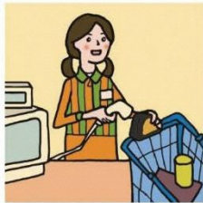
家計を支えるために労働をして、障がいや病気のある家族を助けている