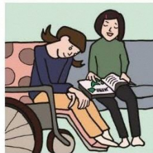
障がいや病気のあるきょうだいの世話や見守りをしている