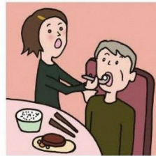
障がいや病気のある家族の身の回りの世話をしている