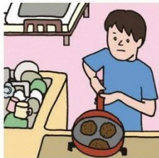
障がいや病気のある家族に代わり、買い物・料理・掃除・洗濯などの家事をしている

家族にケアを要する人がいる場合に、大人が担うようなケア責任を引き受け、家事や家族の世話、介護、感情面のサポートなどを行っている18歳未満の子どもをいいます。