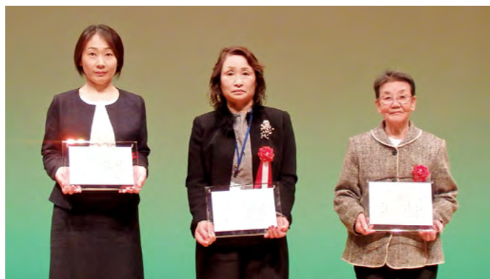
市民会議会長表彰受賞者▶