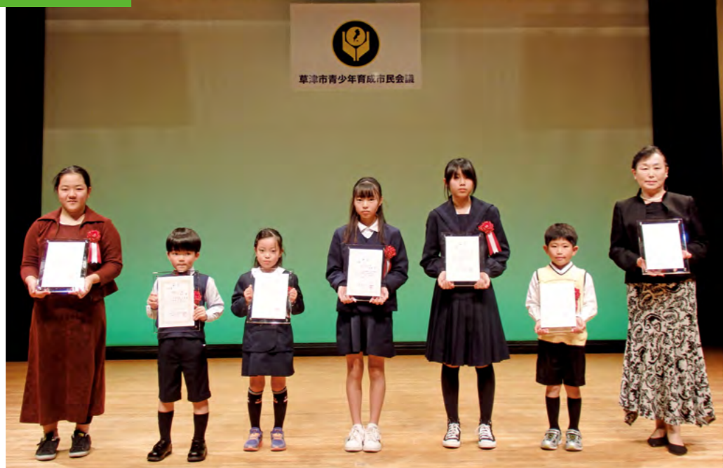
挨拶(あいさつ)運動啓発作品入賞者