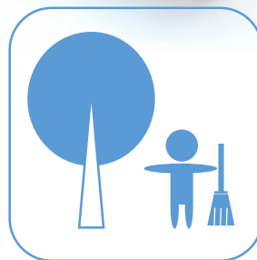
公園等の清掃や 維持管理