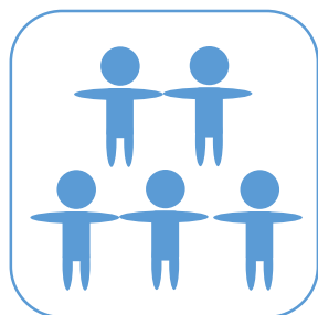
地域コミュニティ の形成