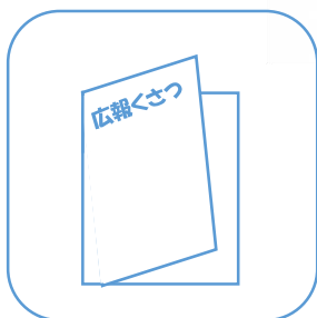
市からのお知らせ の配布