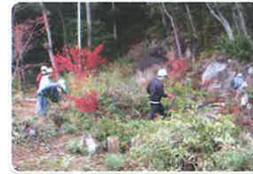
ふれあいの森づくり