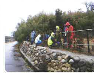
生活環境の緑づくり