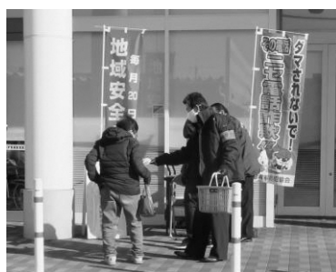
栗東市域での活動

令和5年1月20日、滋賀県防犯協会が行う「地域安全相談所」の開設に合わせ、栗東市のフレンドマーケット栗東店、草津市のコーナン