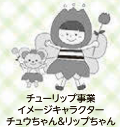
チューリップ事業 イメージキャラクター チュウちゃん&リップちゃん

不安を抱える女性が社会の絆・つながりを回復することができるよう、「草津市社協チューリップ事業」では生理用品の提供を通じて、必要な相談や支援につなげます。生理の貧困解消のためにこの取組にご理解いただき、皆様からの寄付のご協力をお願いします。