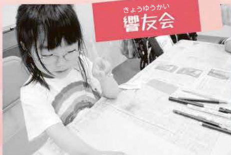
きょうゆうかい 響友会

子ども会、老人会をはじめ、地域の季節のイベント時に書道を教えておられます。書道だけでなく子どもも楽しめるはがき・うちわ作成などもあります。