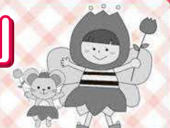
チューリップ事業イメージキャラクター チュウちゃん&リップちゃん

「草津市社会福祉協議会チューリップ事業」では不安を抱える女性が孤立することなく、社会の絆・つながりを回復することができるよう、生理用品の提供の機会を通じて、必要な相談や支援につなげます。生理の貧困解消のために、この取組へのご理解とご寄付のご協力をお願いします。