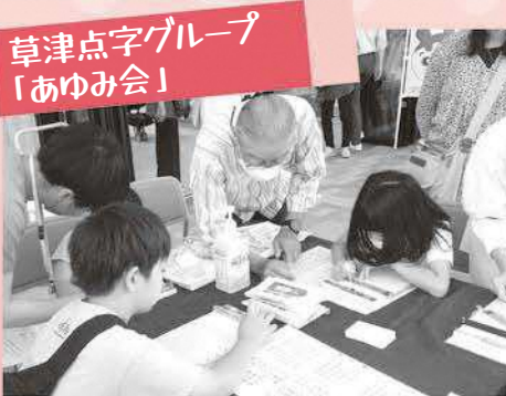
草津点字グループ 「あゆみ会」

子ども会、老人会をはじめ、地域の季節のイベント時に書道を教えておられます。書道だけでなく子どもも楽しめるはがき・うちわ作成などもあります。