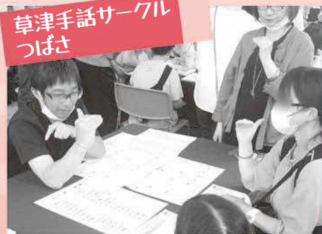
草津手話サークル つばさ

広報紙や本などの点訳をされています。福祉教育で小学校などにも出向き点字を教えてください。