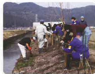
生活環境の緑づくり