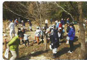
ふれあいの森づくり