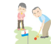
グラウンドゴルフ