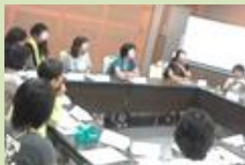
くさつ輝け☆パールプロジェクト