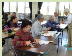
ゴーヤーカーテン普及啓発事業