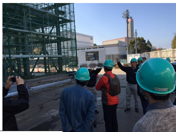
昨年度実施した見学会の様子