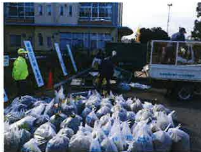
▲市内散在性ごみ一斉清掃