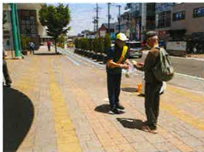
▲ポイ捨て防止市民行動の日