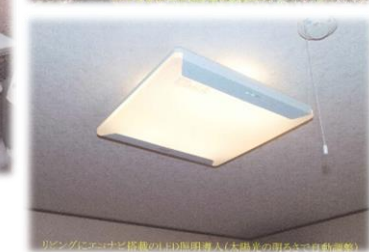
<エコナビ搭載のLED照明導入>