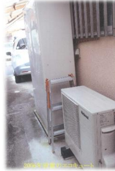
<エコキュートの設置>