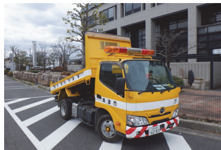
緊急作業用ダンプカー