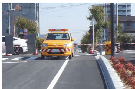
草津市道路パトロールカー