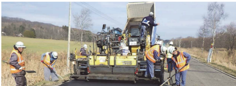
アスファルト舗装工事の状況

道路整備分野でのCO 2 削減については、求められる品質を保持した新たな低炭素建設資材や、低炭素建設機械の技術開発・普及・促進が国において進められているところです。このことから、例えば低炭素アスファルトなど、今後の技術の確立や市場の流通の動向を踏まえ、本市においても使用可能なものについて、導入の検討をしていくものとなります。