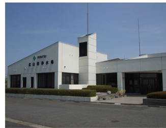
北山田浄水場管理棟