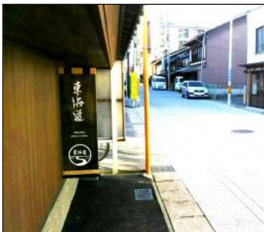
滋賀県大津市京町一丁目付近