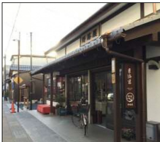
滋賀県草津市 草津三丁目付近