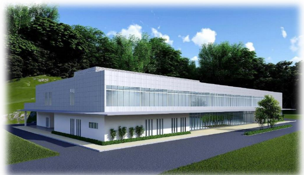
調査業務報告書より