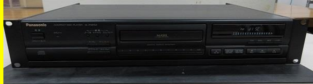
コンパクトディスクプレイヤー SL-P3815Z