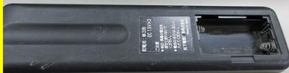
リモコンの裏蓋なし