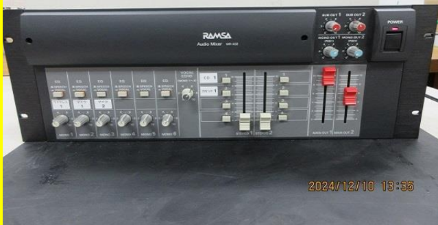
オーディオミキサー WR-X02