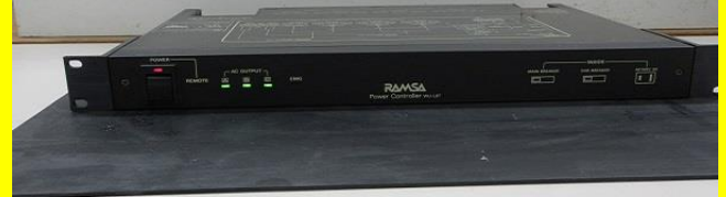
電源制御ユニット WU-L67