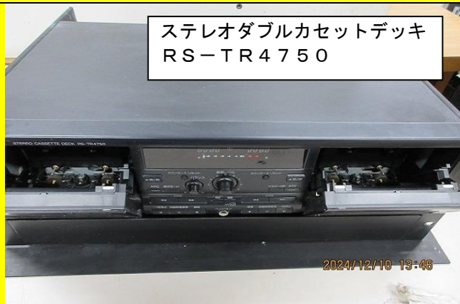
ステレオダブルカセットデッキ RS-TR4750