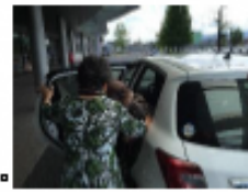
↑地域支え合い運送支援

これまでの会議を振り返り、会議で実感できたこと・持ち越している課題を整理しました。より多くの住民へ高齢者の暮らしの問題や地域の多様な活動、社会資源を周知するため、開始から15回目を契機にフォーラムを開催する予定です。