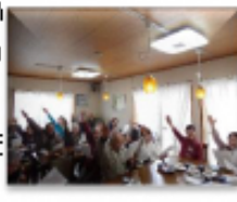
↑ふれあいのウス絆 敬高喫茶

会議の開催に向けて、事前研修会や先進地への視察を実施しています。例えば、今展開している高齢者を支える活動が、10年後も続いていくようにするには？ もっと志津南をよくしていくための語り 合う場が、 間もなく始まります。