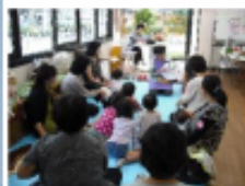
↑ゆかい家にて 子育てサロン

地域から愛されている“ゆかい家”を拠点に、今年度立ち上がろうとしている、その名も「草津学区の健幸を語り合うプロジェクト」。考え込まないで、まずはみんな、ここで語り