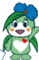
市社協キャラクター みくぢゅん