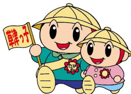
草津市公認マスコットキャラクター たび丸